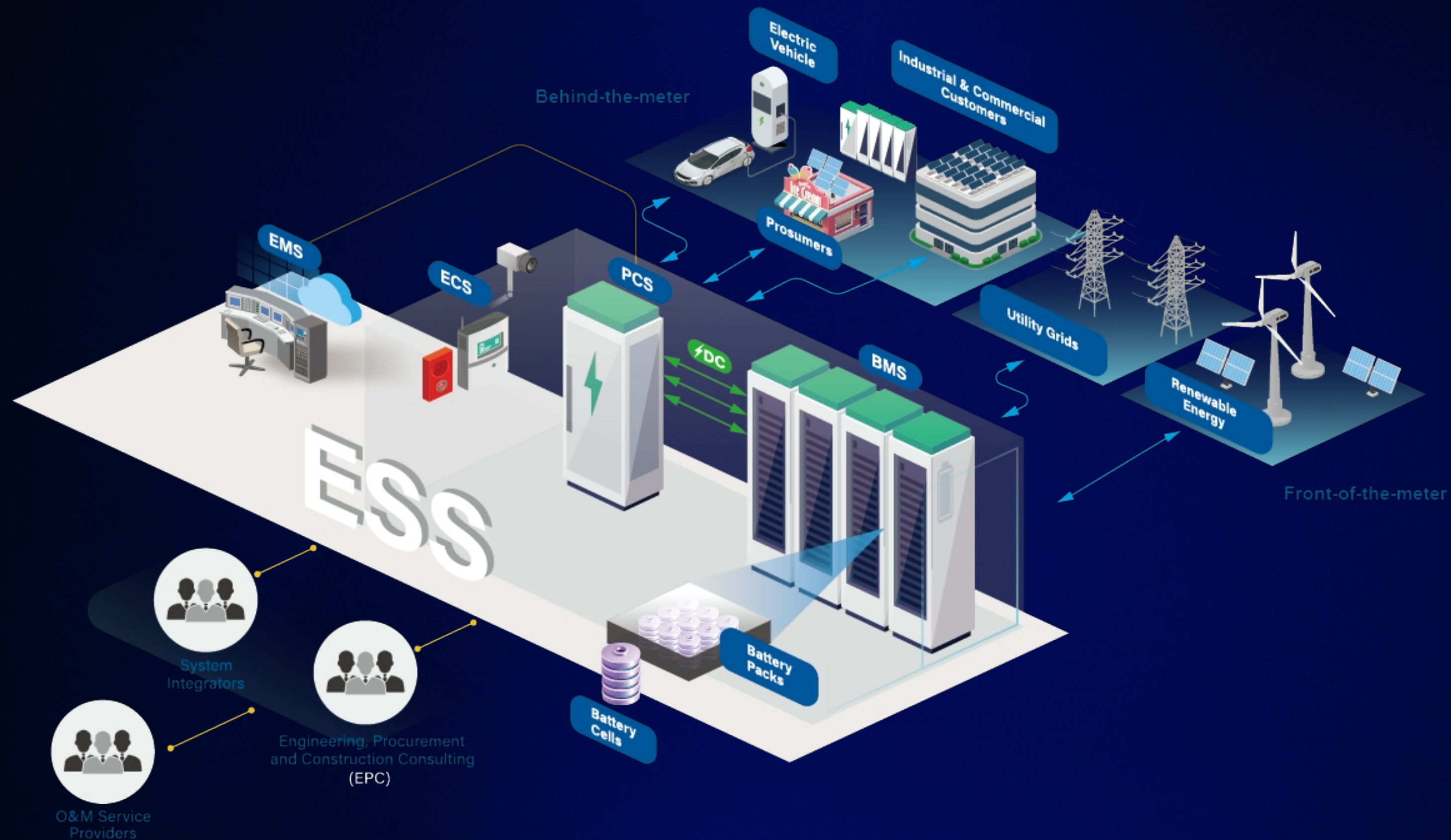
Схема роботи BESS